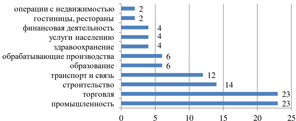
Рис.1. Распределение респондентов по видам экономической деятельности (% опрошенных респондентов)*

Распределение организаций по виду экономической деятельности представлено на рисунке 1. Большинство опрошенных заняты в торговле и промышленности (по 23 % соответственно), строительстве, транспорте и связи (14 и 12 % соответственно).